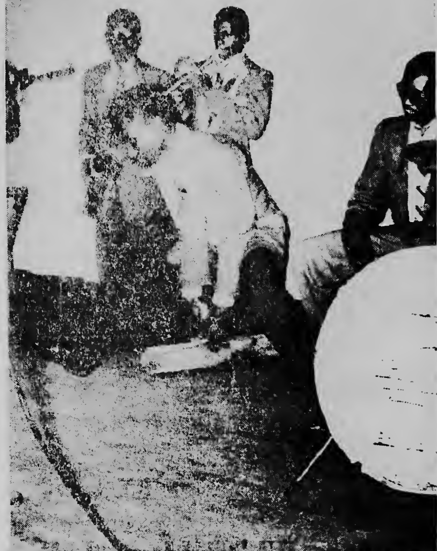
Un bista di Conhunto „San Fernando” cu a mustra gran progreso diasabra anochi den e Bandstand Aruba. Aki nos ta mira e tocado di raspa duna un demonstracion di baile, cu a worde aplaudi masha hopi pa e concurrencia.